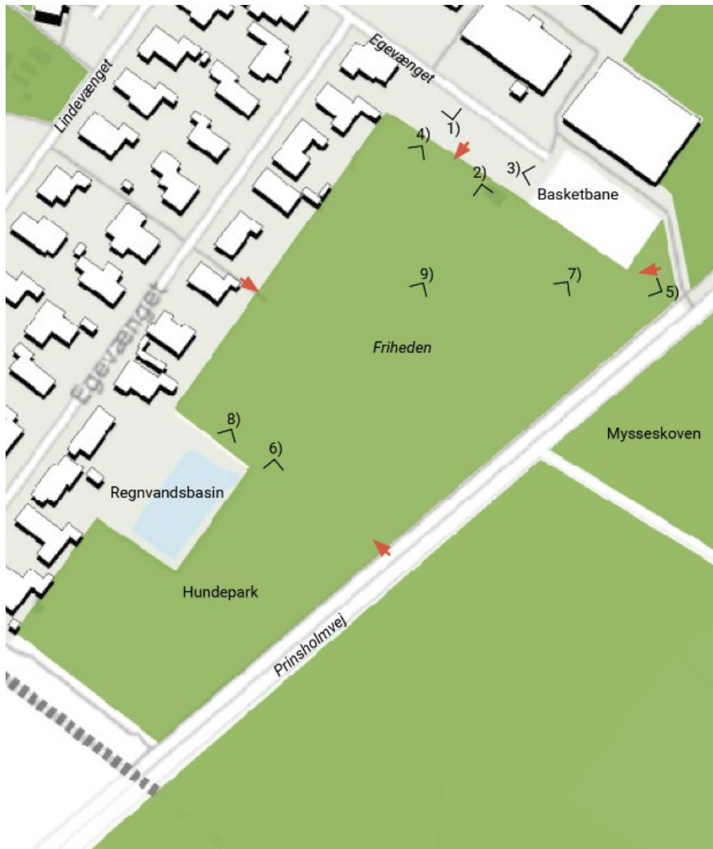
Figur 3: Kort over græsarealet for det kommende mødested 'Friheden'. De indtegnede tal og synsvinkelpåtegninger viser, hvor fotos i figur 4 er taget.

Vores observationsstudie viser at græsarealet, hvor 'Friheden' skal opføres, især bruges af den nærliggende Østerbro-skoles elever i frikvarterer. Stedet bruges derfor overvejende af en homogen gruppe, og involverer ingen nye møder. I eftermiddagstimerne og i weekenderne står græsarealet, bortset fra hundeparken, stort set tom (se fotos i figur 4 og figur 5).