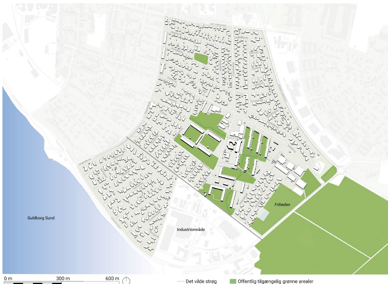
Figur 1: Kort over bydelen Østerbro i Nykøbing Falster, herunder Lindholmkvarteret og placering af det kommende mødested 'Friheden'

For at skabe bedre sammenhæng mellem Lindholmkvarteret og resten af Østerbro og Nykøbing Falster 7 , er mange grønne områder blevet betragteligt opgraderet de sidste år. Eksempelvis har et samarbejde mellem kommunen og en privat lodsejer om udbygningen af Mysseskoven tilvejebragt offentlig adgang til skovstier, shelter, sø og natrum med plads til leg og udfoldelse. Samtidig har etableringen af den lille folkepark Æblelunden skabt et grønt byrum med æbletræer, grill, borde, skak og rum for leg (se nedenstående oversigtskort). Det største projekt kaldet Det Vilde Strøg er skabt i samarbejde mellem boligselskaberne Fjordparken og Nykøbing F. Boligselskab, Landsbyggefonden og Guldborgsund kommune 8 . Her er der blevet anlagt stiforløb, multibane, legeplads, og siddekroge med blomster, træer og frugtbuske. Med de nye stiforløb inviteres der med nye adgangsmuligheder og aktiviteter ind til at boere i og omkring Lindholm kan tage området i brug. Med anlæggelse af Mysseskoven, Æblelunden og Det Vilde Strøg forsøger man at synliggøre Lindholmkvarterets potentialer og muligheder, så man på sigt kan styrke omdømmet og brugen af de offentlige mødesteder i Lindholm og på Østerbro.