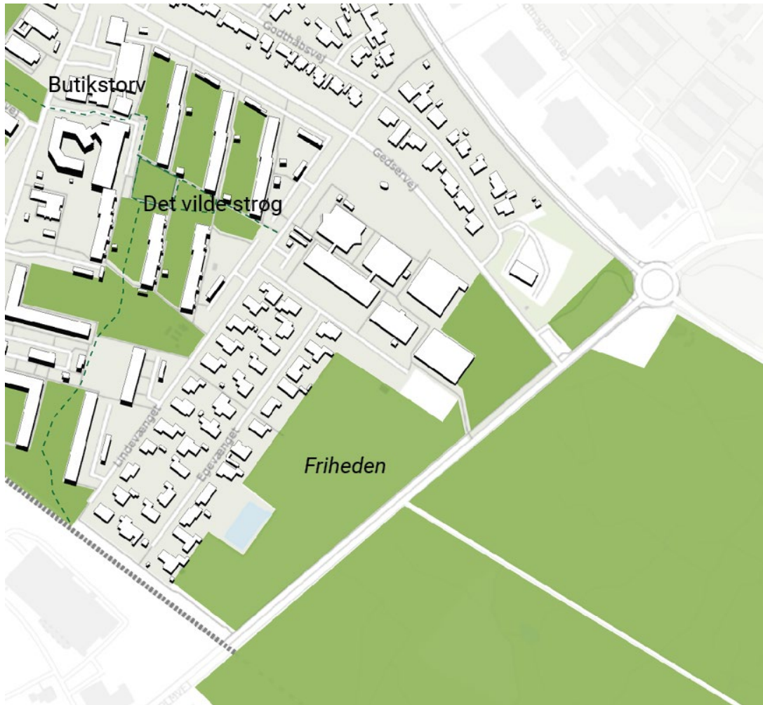
Figur 2: Oversigtskort over lokale mødesteder i Lindholmkvarteret

Vi har undersøgt og beskrevet stedet for det planlagte mødested og alternative mødesteder i lokalområdet. I figur 2 ses placering af de undersøgte steder. I det følgende beskrives først arealet for det kommende mødested 'Friheden', hvorefter de øvrige lokale mødesteders brug beskrives på baggrund af observationer og feltbesøg. Dette afrundes med resultater fra spørgeskemaundersøgelserne om brug af eksisterende mødesteder i området.