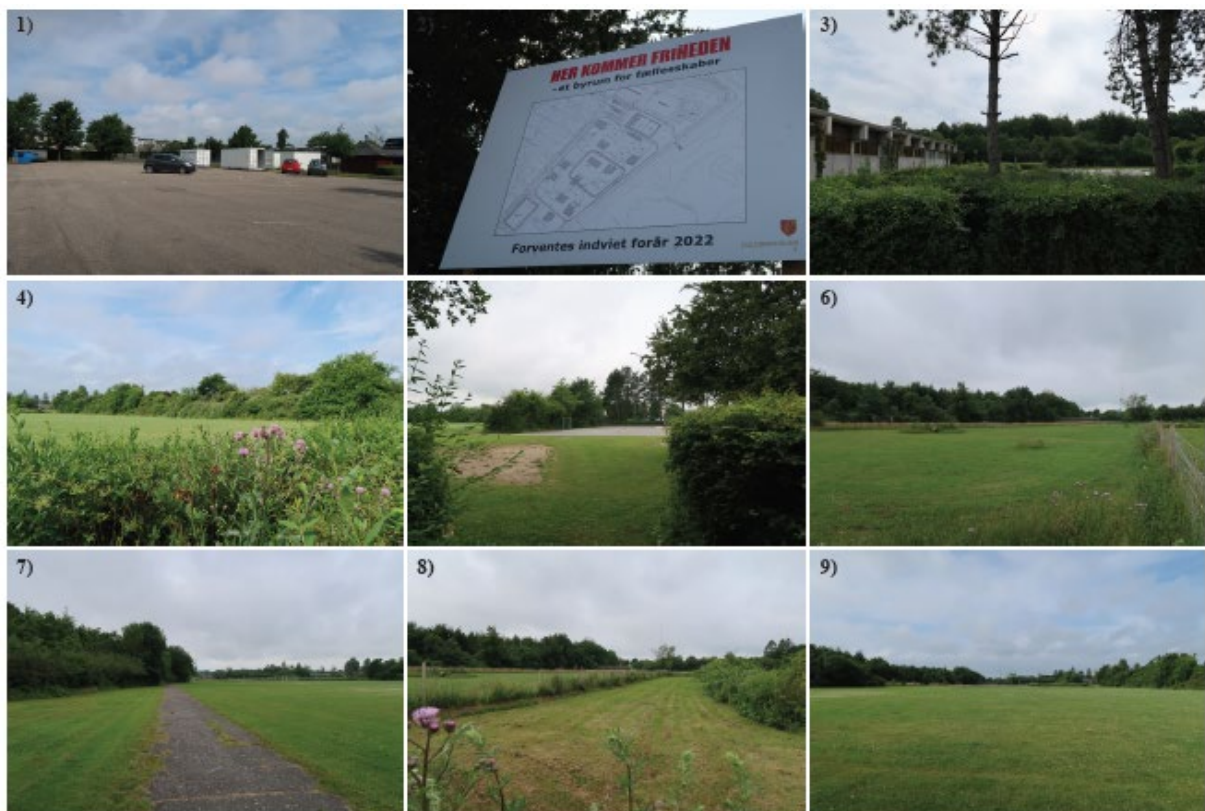
Figur 4: Fotos fra græsarealet for det kommende mødested 'Friheden'.