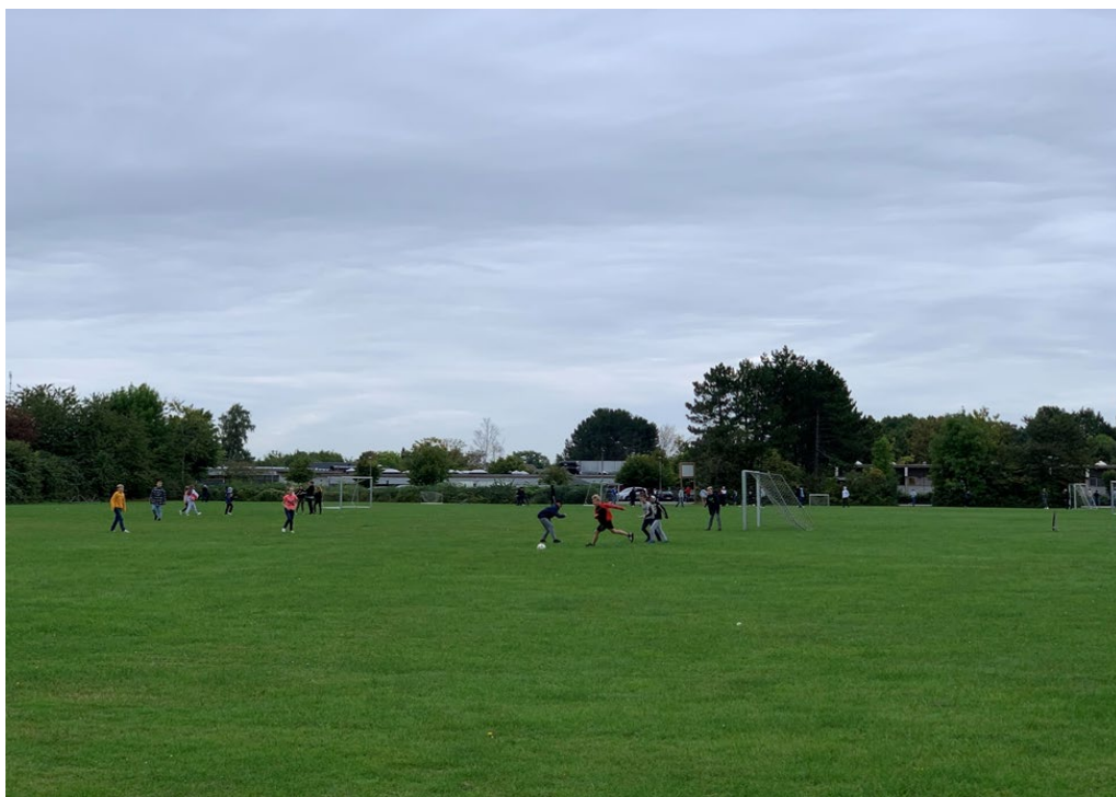
Figur 5: Aktiv brug af boldbanen på 'Friheden' i skolens frikvarter, 21. september 2021.